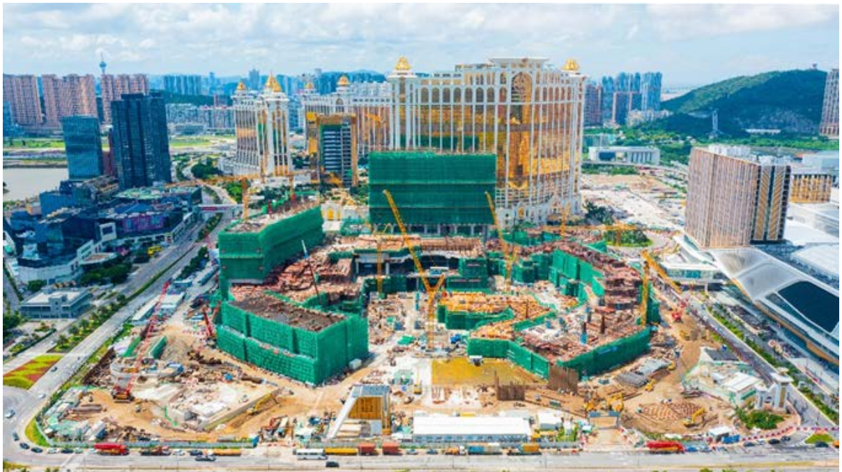
2022 年第二季度的路函第四期照片