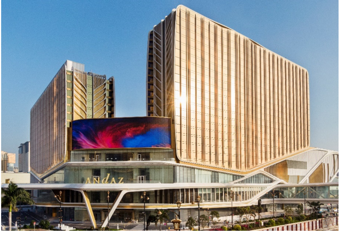
银河国际会议中心、银河综艺馆及安达仕酒店大楼