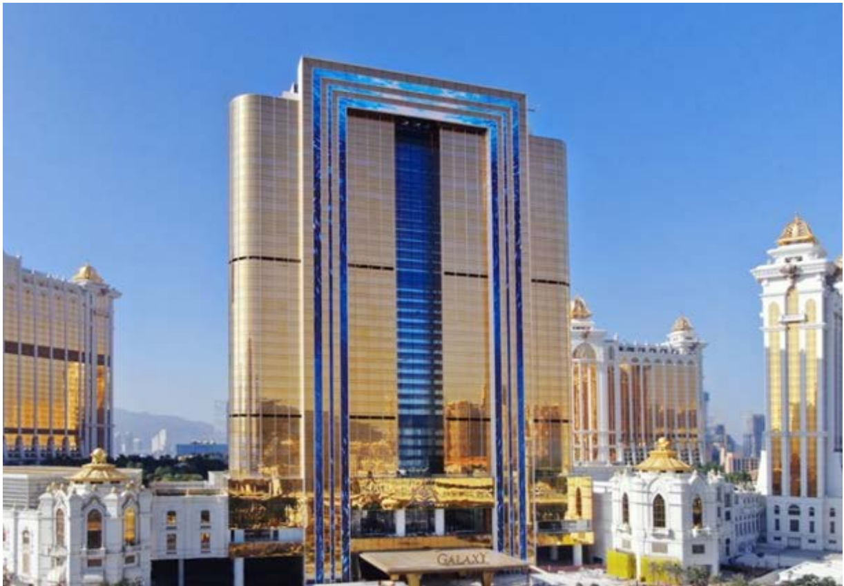
澳门银河 莱佛士之最新照片

第三及四期将合共提供约3,000间适合高端和家庭旅客的客房及别墅、400,000 平方呎的会议展览空间、500,000 平方呎并设有 16,000 个座位的多用途场馆、餐饮、零售以及娱乐场等。由此可见，我们透过路氹第三及四期以支持澳门成为「世界旅游休闲中心」的愿景，对澳门的未来充满信心。