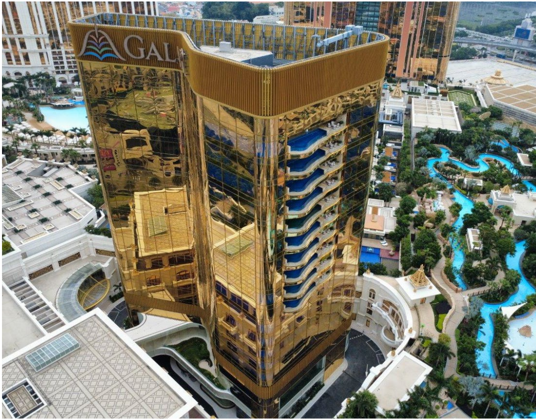
澳門銀河 嘉佩樂之最新照片 (2025 年 5 月)