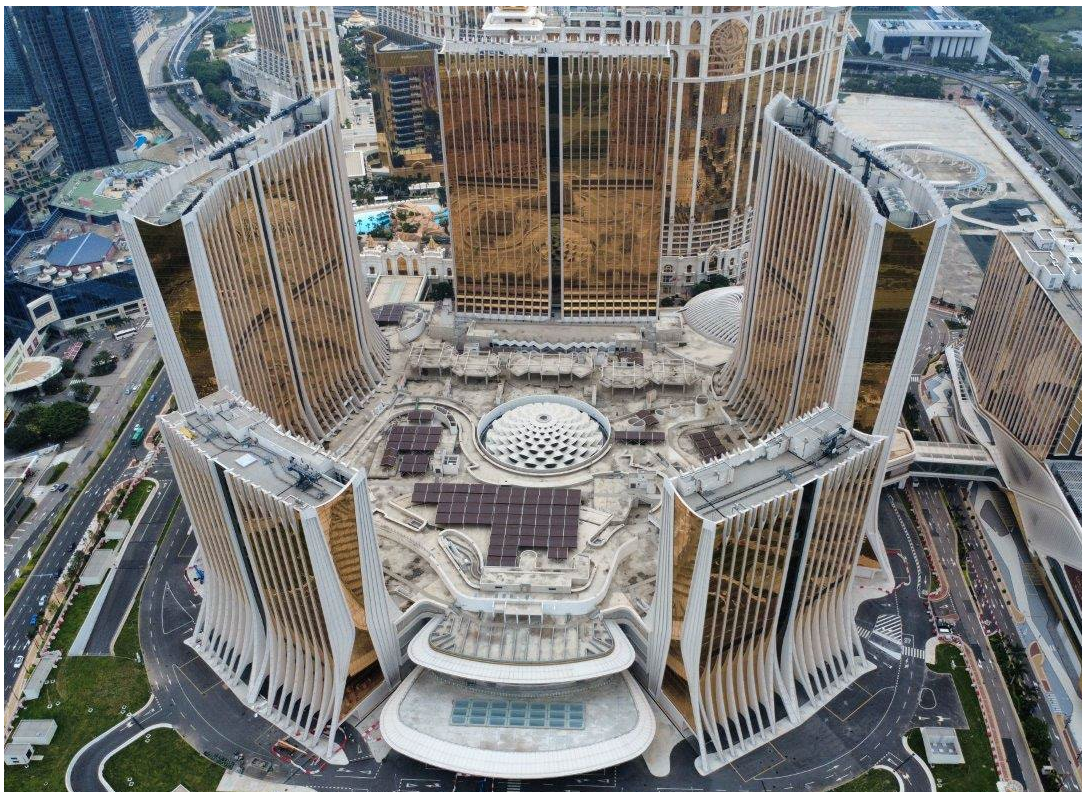
路氹第四期之最新照片 (2025 年 5 月)